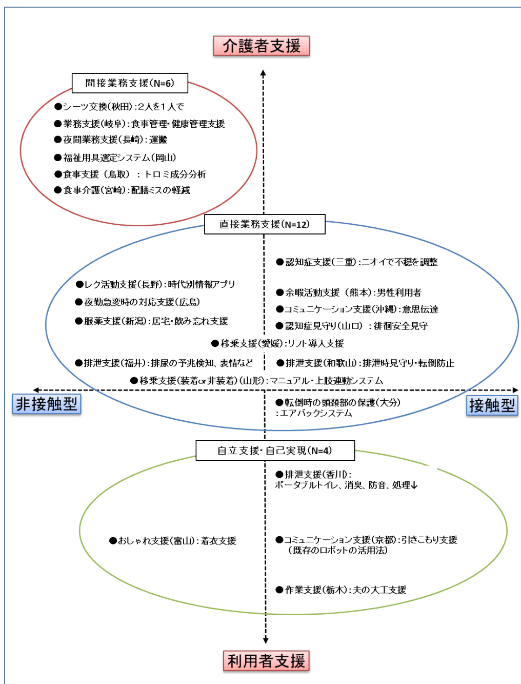
図 iv-5-2 協議会提案テーマの属性（一般枠：N=22）

一般枠 22 件のうち介護者支援の提案は、直接業務支援が 12 件であり、そのうち接触型 6 件、非接触型 4 件、中間型 2 件であった。接触型は認知症、余暇活動、排泄支援、利用者の転倒時における頭部保護であった。非接触型はレクリエーション、夜間急変時対応、服薬、排泄、移乗支援であった。中間型は移乗支援であった。一方、間接業務支援は 6 件すべてが非接触型であり、シーツ交換、食事管理、夜間搬送、福祉用具選定、食事（トロミ）、食事（配膳）の支援であった。また、利用者支援の提案は 4 件であり、接触型は 3 件で排泄、コミュニケーション支援に加えて、余暇活動（木工）支援であった。一方、非接触型は 1 件であり、おしゃれ支援であった（図 iv-5-2）。